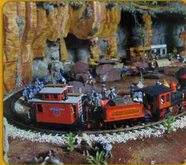
Un grand canyon, le train chemine, au lointain, le feu des indiens.