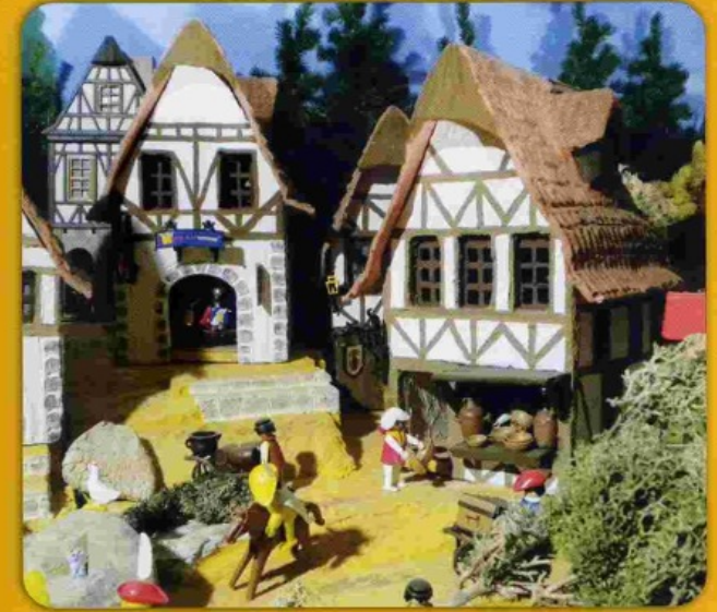
Cité médiévale, chaumières, collines où chantent les oiseaux et s'illuminent les maisons