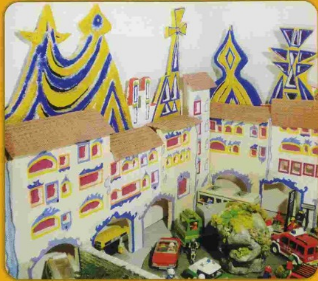
Une cité contemporaine d'architectes, peintres · Gaudi, Hundertwasser.