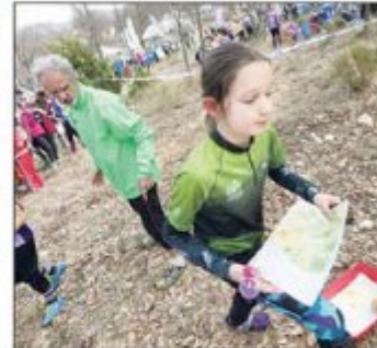
Les meilleurs coureurs ont réalisé le parcours en une vingtaine de minutes... Les autres en plus d'heure.