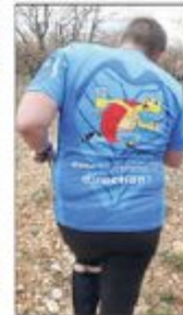
La catégorie Élite devait parcourir 6,5 km dans un environnement exceptionnel.