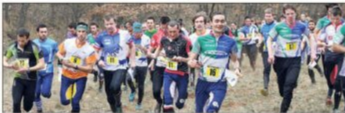
Les départs se sont échelonnés toute l'après-midi.