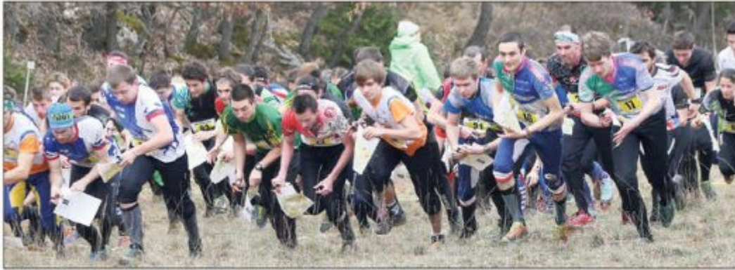
Hier à Bauduen, près d'un millier de participants a pris part à la course d'orientation de moyenne distance.